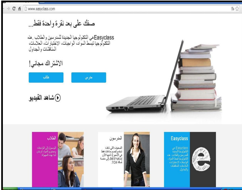
شكل (٣) واجهة التفاعل الرئيسية لشبكة "Easyclass"