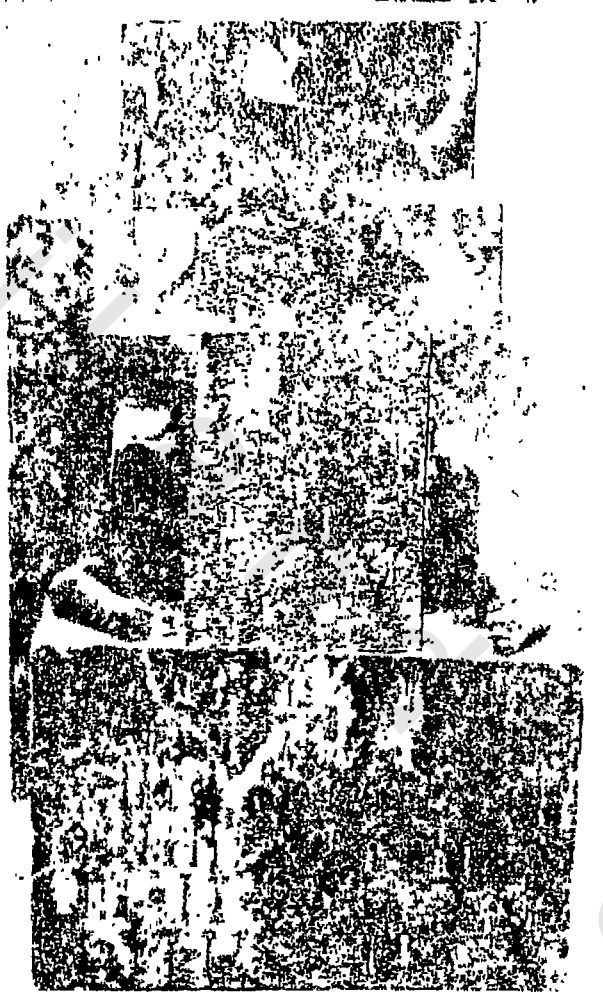
تمثال مصنوع من البرنز ، عثر عليه على مقربة من ( تمنع ) من كتاب Qataban and Sheba صفحة ( ١٨١ )

ان القتبانيين كانوا يقطنون في الأقسام الغربية من العربية الجنوبية ، وفي جنوب السبئيين وفي جنوبهم الغربي ، وقد امتدت منازلهم حتى بلغت (باب المندب) ١ . وذكر ( ياقوت الحموي ) أن ( قتبان ) موضع في نواحي ( عدن ) ٢ . ويعد