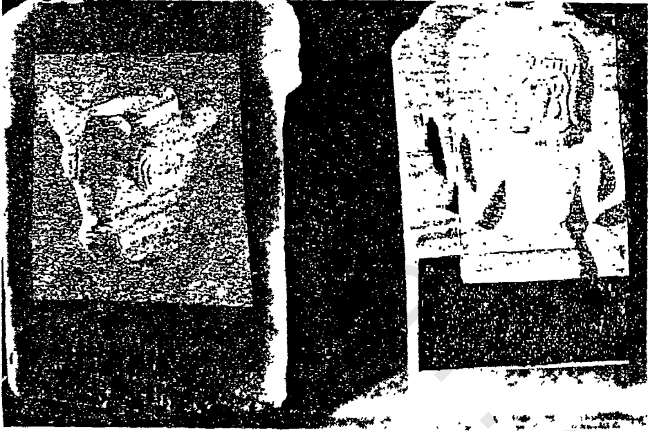
من تماثيل شرعليها في مقبرة (تمنخ) ، ويعود عهدها الى ما قبل الميلاد من كتاب Qataban and Sheba (الصفحة ١٢٥)

وورد في الكتابات اسم مدينة تدعى ( برم ) . فورد في كتابة من أيام الملك ( يدع اب ذبيان بن شهر ) مكرب قتيان ، كتبت عند تمهيده الطريق بين هذه المدينة ومدينة ( حرب ) ( حريب ) وانشاء مبلقة أي شق طريق جبلي ، ليساعد على الوصول ببسر وسهولة بسين المكائين ٢ . وورد في كتابة أخرى عند انتهاء الملك ( يدع اب ذبيان ) من بناء ( برج برم ) ٣ . وهناك وادٍ عرف بوادي