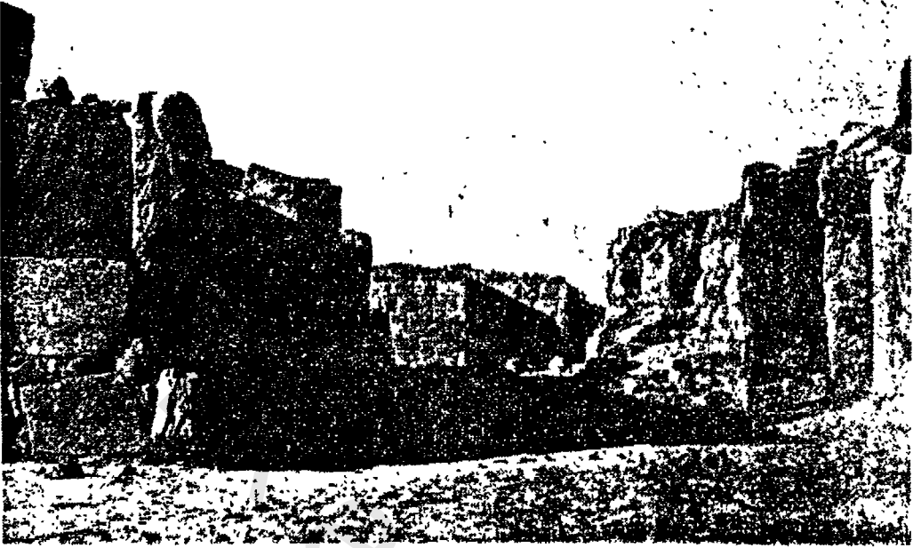
الجانب الجنوبية لمدينة « تمنع » . وقد كانت هذه الآثار مطمورة تحت الرمال ويعود تأريخها الى القرن السادس قبل الميلاد من كتاب « Qataban and Sheba » ( الصفحة ١١٨ )