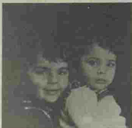
صحيح أن من الولد ولد الولد... ابن الخليل

قالوا ل إن عبدملك إعلان... قد بعد ثلثيا منذ أصبح جفا معظم أسبابه بتفصيلا في البيت بعد أن كان دائم الغفطان... فقد كرت ما كانت تزده لى... آخر الولد... ولد الولد... أي - الخليل! إنما حقيقة لأبصارها إلا الخلد أو الخدة.