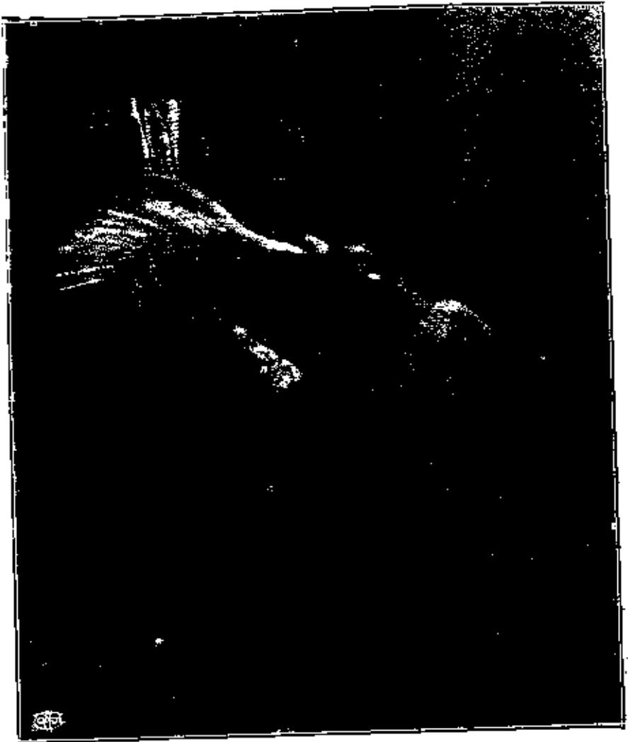
الطائر الكبير هو فرخ الوقواق والذي يزفهُ هو الطائر الذي نشأ في عشهِ مقتطف يونيو ١٩٣٣ امام صفحة ٥